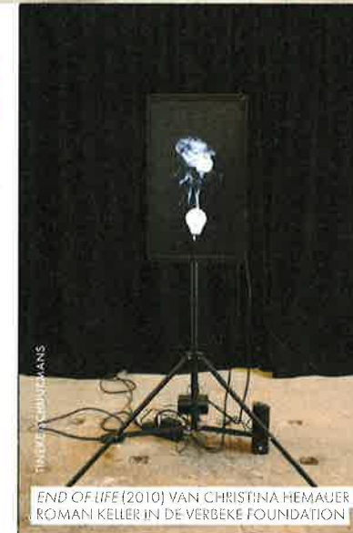
END OF LIFE (2010) VAN CHRISTINA HEMAUER EN ROMAN KELLER IN DE VERBEKE FOUNDATION

We gaan de grens over: bonjour België! In het plaatsje Kemzeke, niet ver van Antwerpen, zit de Verbeke Foundation, met twintigduizend vierkante meter kunst uit de privéverzameling van het echtpaar Verbeke. Kun je gewoon bezoeken. Sterker: je kunt er een overnachting in een kunstwerk boeken! De collectie bestaat uit veelal modern en hedendaags werk van Belgische kunstenaars, waaronder een aanzienlijke hoeveelheid 'bio art'; kunst van levende materialen zoals planten en dieren. Alles behalve standaard dus. De Verbekes zeggen zelf: 'Onze presentatie is onaf, in beweging, ongepolijst, contradicto- risch, slordig, complex, onharmonieus, levend en onmonumentaal, zoals de wereld buiten de museummuren.' verbekefoundation.com