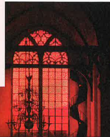
GIORGIO ANDREOTTA CALÒ ZETTE DE OUDE KERK IN EEN ANDER DAGLICHT