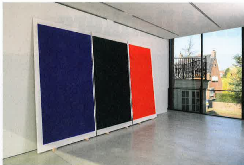
Kees Visser, Blauw Groen Rood , 2019. Acryl op papier, 390 x 250 cm

Wat Kees Visser ons laat zien in zijn drieluik is dat kleuren in het beweeglijke licht van de dag waarlijk verrassingen zijn. Ze gedragen zich niet streng. Rudi Fuchs