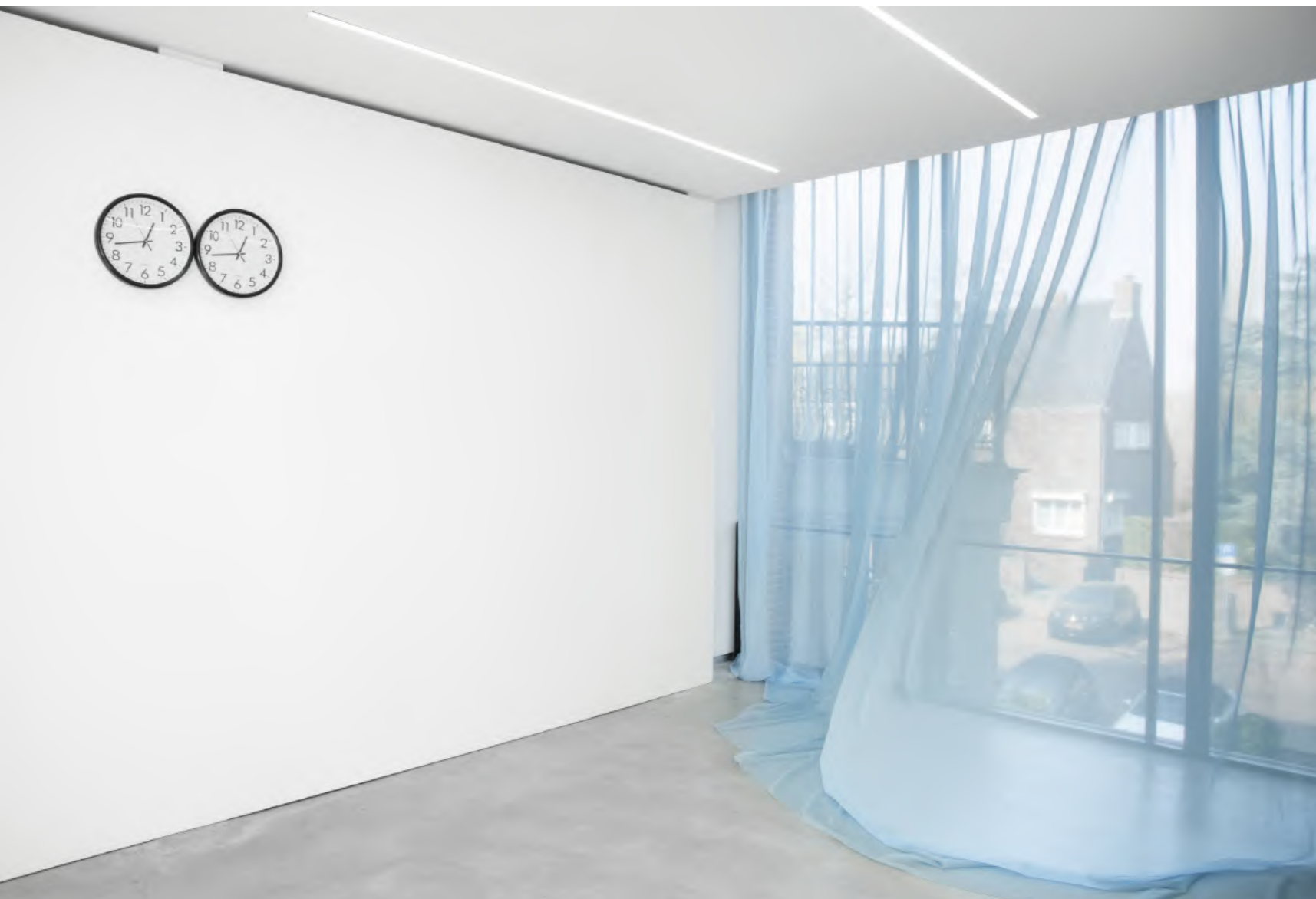
Félix González-Torres, Untitled (Perfect Lovers), 1987–1990, editie van 3, en Untitled (Loverboy), 1989, courtesy Félix González-Torres Foundation, te zien in EENWERK in 2025

Van vrienden kregen we 2200 jaar oude Romeinse ringen. Tijd is een ongrijpbaar iets, zeker op dat moment was alles relatief en stond de wereld op zijn kop. Het begrip tijd wilde ik dan ook onderdeel maken van de tentoonstelling. Ik sprak over het idee van de tentoonstelling met Steve McQueen en hij zei meteen: je moet Félix González-Torres laten zien, Perfect Lovers , jullie waren “perfect lovers”. Dat zijn de twee analoge klokken naast elkaar die elkaar net aanraken. Het werk is gemaakt in een oplage van drie edities, maar heel toevallig zit er één bij een verzamelaar in de buurt.