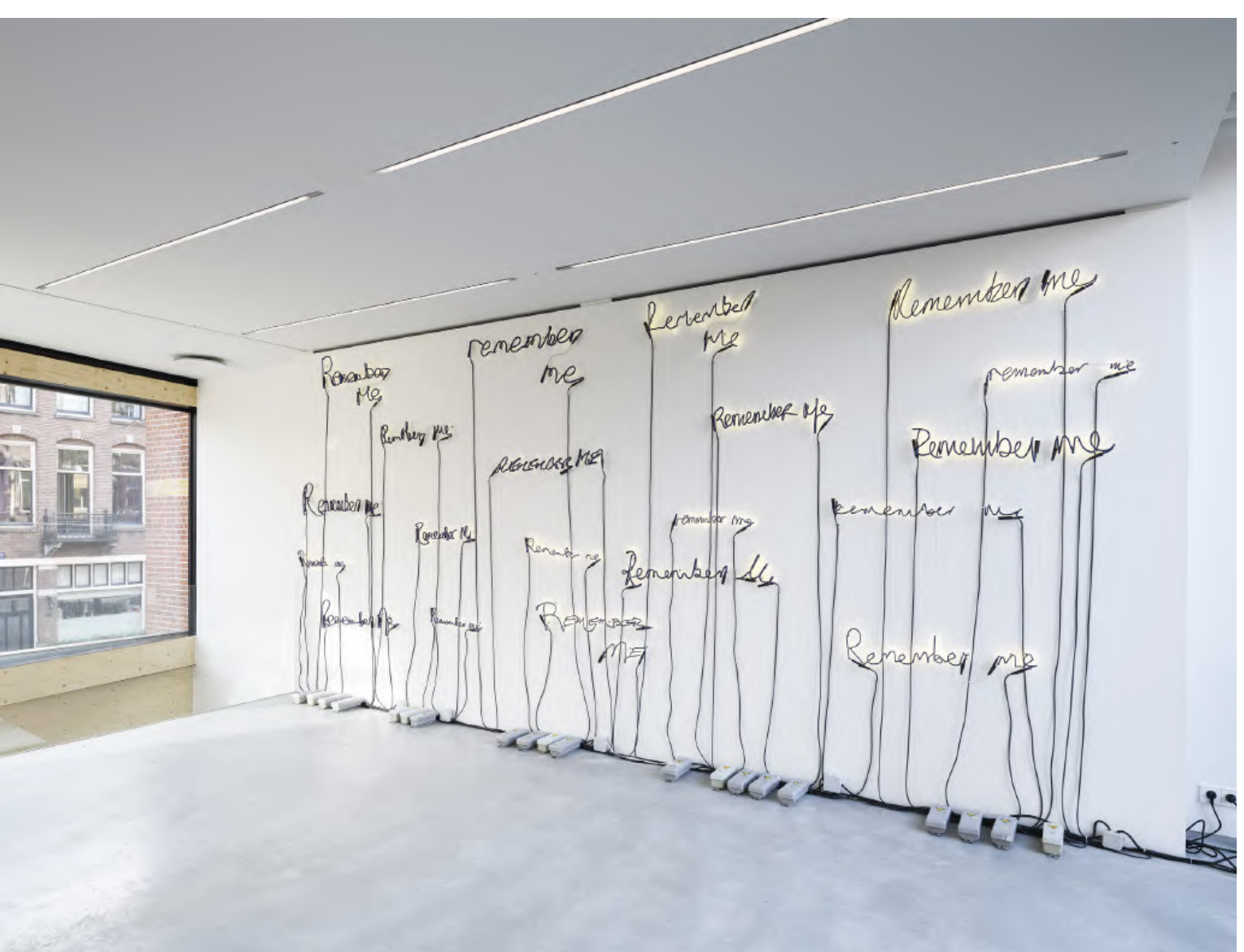
Steve McQueen, Remember Me , 2016, installatie, courtesy Marian Goodman Gallery/Thomas Dane Gallery, te zien in EENWERK in 2017, foto Peter Cox

Alice Weiner komt regelmatig bij EENWERK. Met zijn werk laten we talige kunstwerken zien, wat goed past in de traditie van EENWERK die Julius heeft gestart. Afgelopen september zijn we verder een nieuw programma gestart, onder de titel EENWERK HELLO . Het werk BAM! BAM! BAM! van de Amerikaanse kunstenaar Alex de Corte beet het spits af. Het is een samenwerking met Sadie Coles, om kunstenaars te tonen die hier normaal nooit te zien zijn. Het is een wisselwerking, voor beide galeries en met name ook voor de kunstenaar een verbreding en verspreiding.